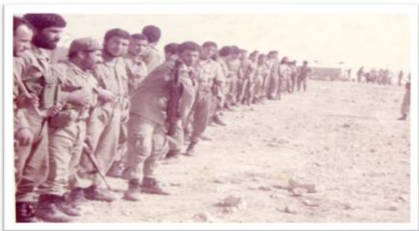
آماده شدن برای عملیات خیبر