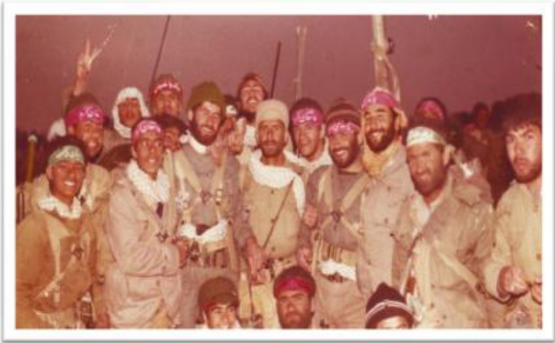
جزیره مجنون قبل از عملیات خیبر ایستاده از سمت ششم شهید محمود عموشاهی