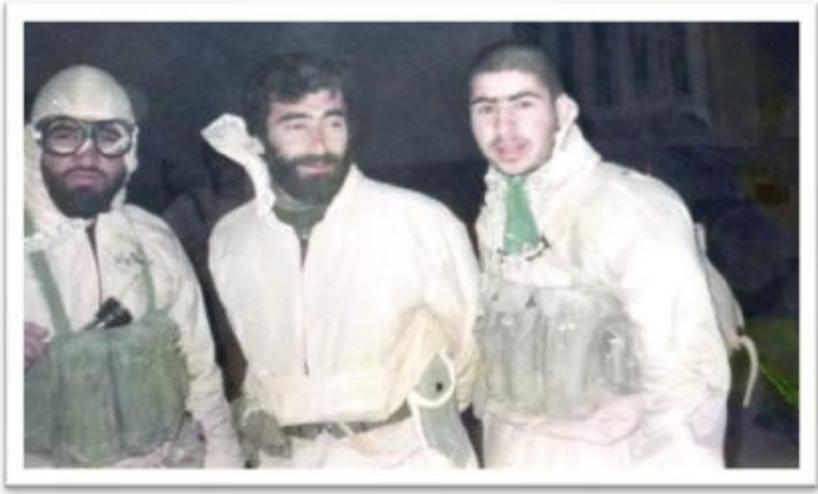
اهواز منطقه جفیر شب عملیات خیبر جزایر مجنون