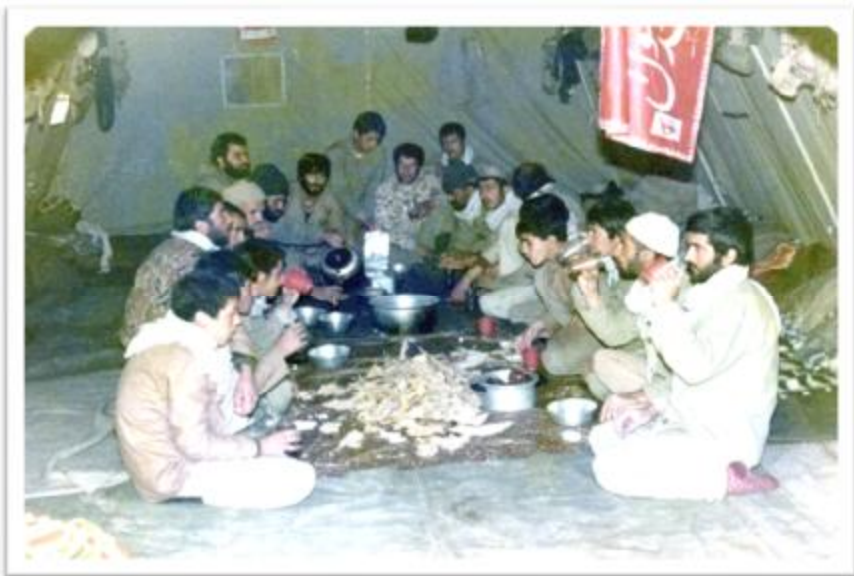
اهواز جنفیر یک هفته قبل از از عملیات خیبر