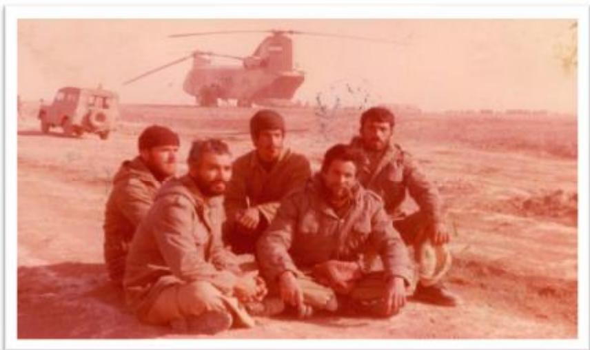
اهواز جفیر یک هفته قبل از عملیات خیبر