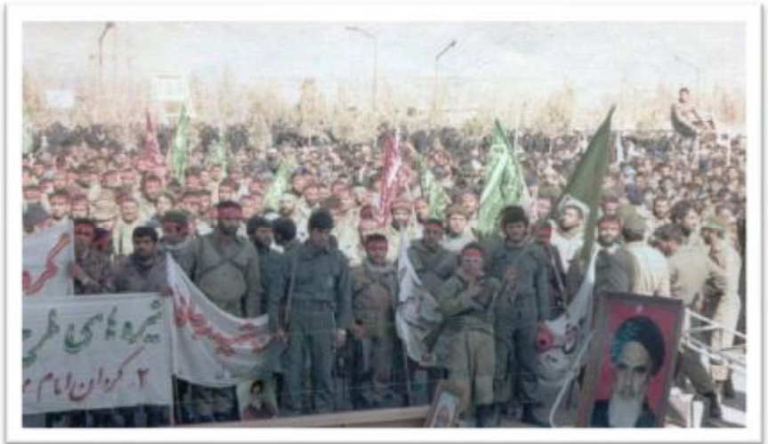
اهواز جفیر یک هفته قبل از عملیات خیر