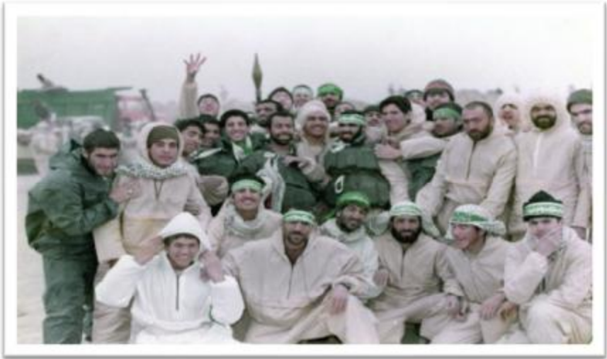
جبهه های جنوب منطقه عملیاتی خیبر جزایر مجنون