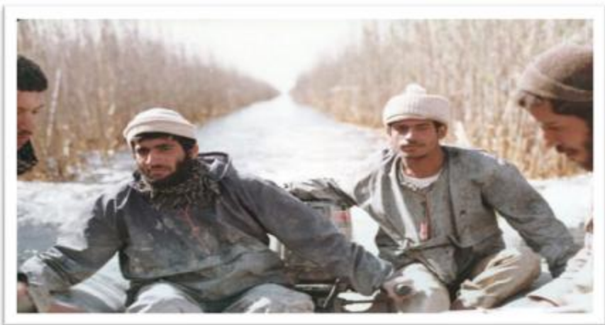
جزیره معجون - عملیات خیبر