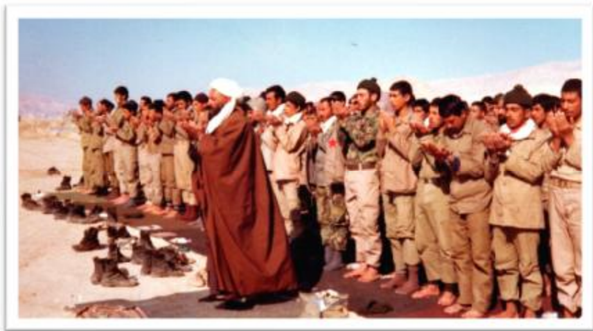
منطقه عملیاتی خیر