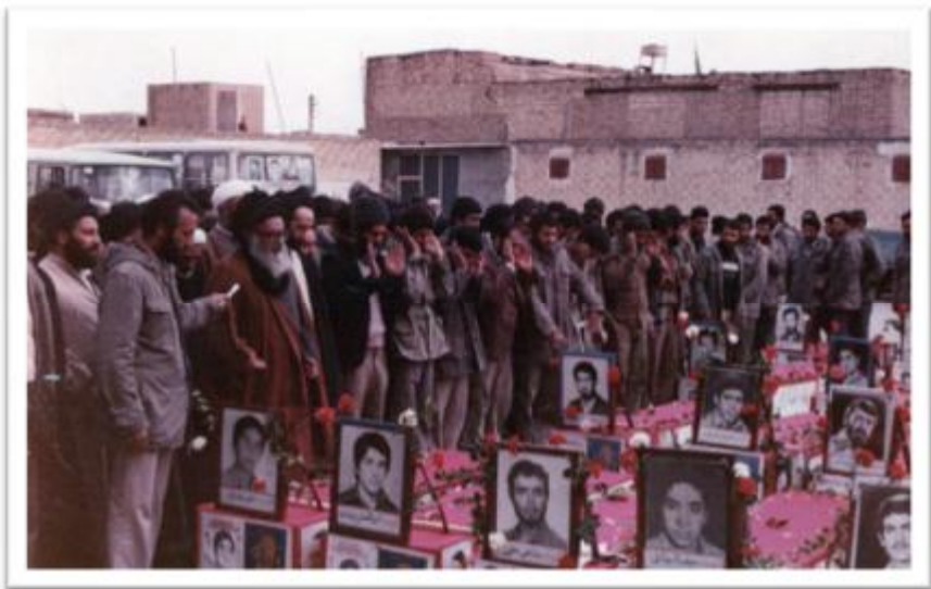
مراسم تشییع شهدای عملیات خیر