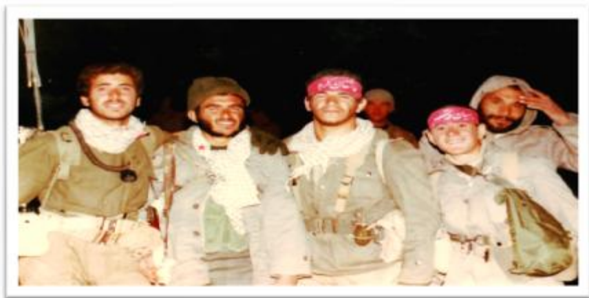
اهواز منطقه جفیر عملیات خیبر رزمندگان لشکر هشت نجف