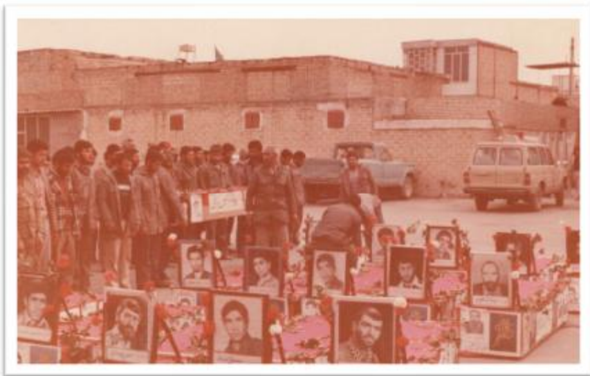
مراسم تشییع شهدای عملیات خیر